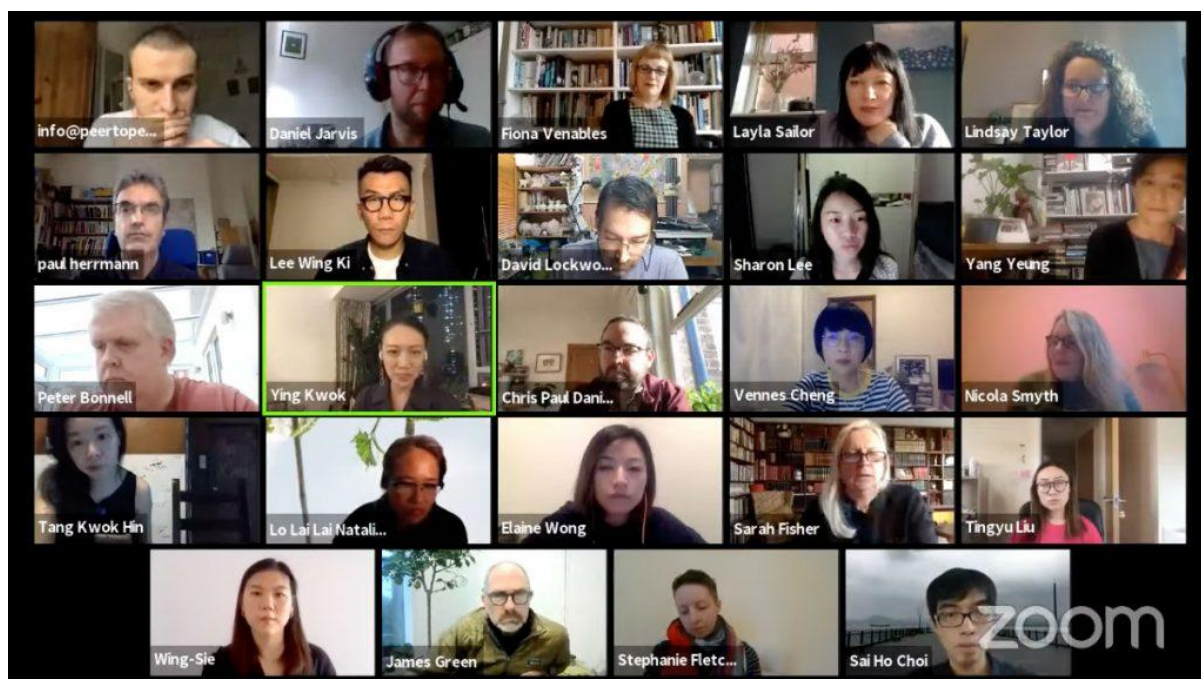
Screengrab from closing session of Peer to Peer:UK/HK 2020

Peer to Peer: UK/HK 2022 這交流計劃，利用視覺藝術元素，表達對未來的關顧和探討如何減低對地球生態的破壞。受疫情影響，英國和香港的參與藝術家及人員沒有進行實體交流，反而透過大家天馬行空的創意，更靈活地運用不同媒介，進行另類的交流合作：在網絡世界、在社交媒體實時交流、錄影、即興演出，甚至以郵遞進行物料上雙邊交流，最終達至全面數碼演繹。